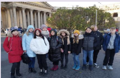
Kazan Cathedral. October, 28