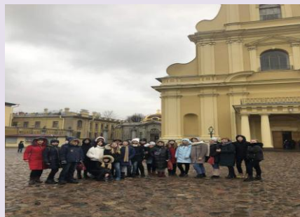
Peter and Paul Fortress in St. Petersburg