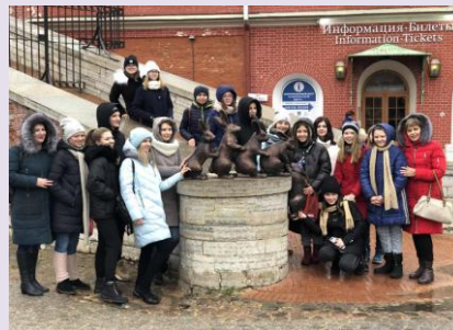
Hair Island. October, 29